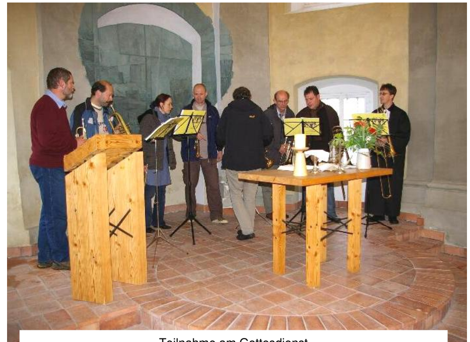
Teilnahme am Gottesdienst der Evangelischen Gemeinde der Böhmisches Brüder in Rumburg