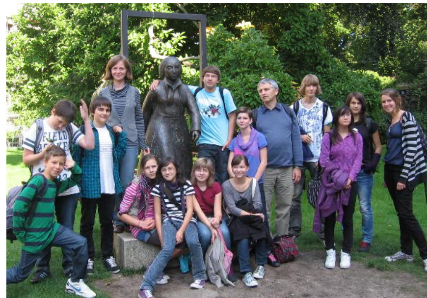
Unsere Exkursion in die Lutherstadt Wittenberg